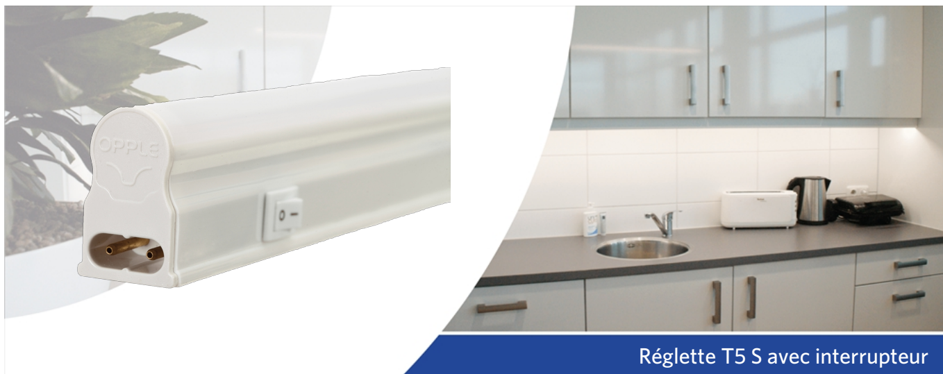
Régllette T5 S avec interrupteur