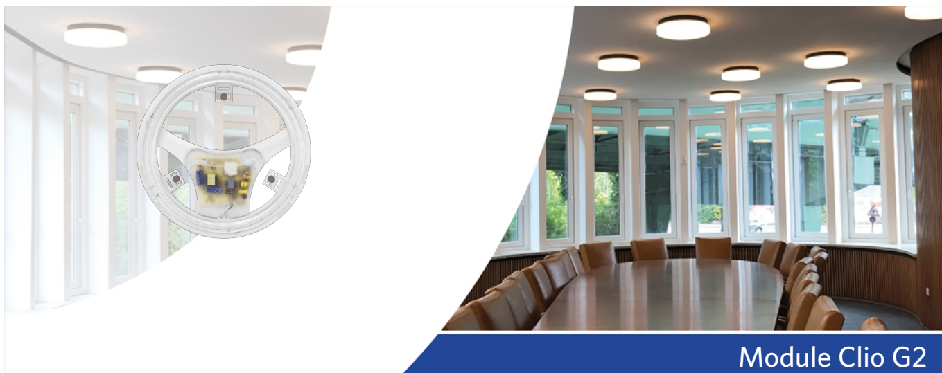
Module Clio G2