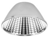
550098000500 LEDSpot3C-C-P R100- Reflector-24D