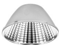
550098000500 LEDSpot3C-C-P R100- Reflector-24D