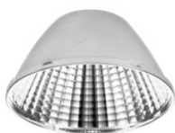
550098001000 LEDSpot3C-C-P R65-Reflector-24D