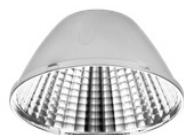
541001187900 LEDSpot3C-C-CS R68-Reflector-24D