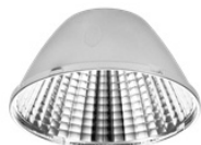
541001188000 LEDSpot3C-C-CS R75-Reflector-24D