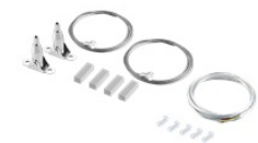
599006009000 LEDLima Suspension-Kit