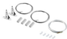
599006009000 LEDLima Suspension-Kit