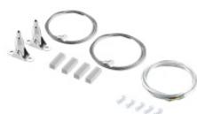
599006009000 LEDLima Suspension-Kit