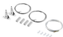
599006009000 LEDLima Suspension-Kit