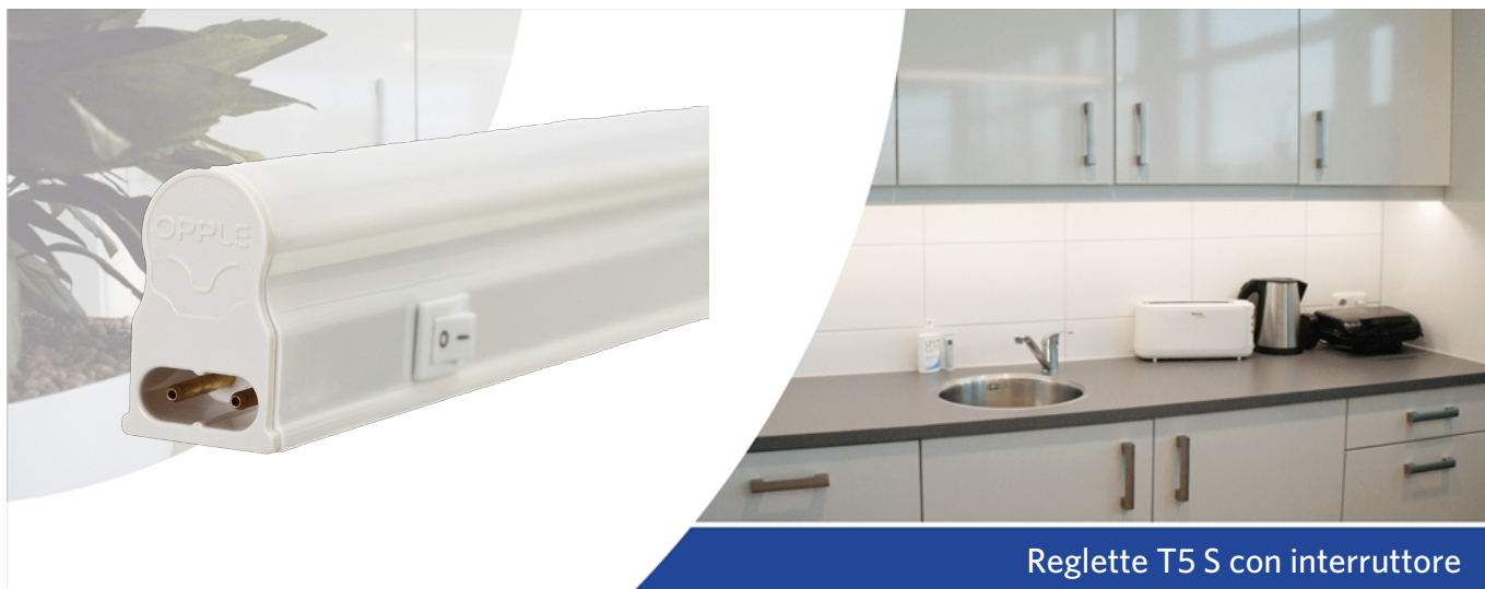
Reglette T5 S con interruttore