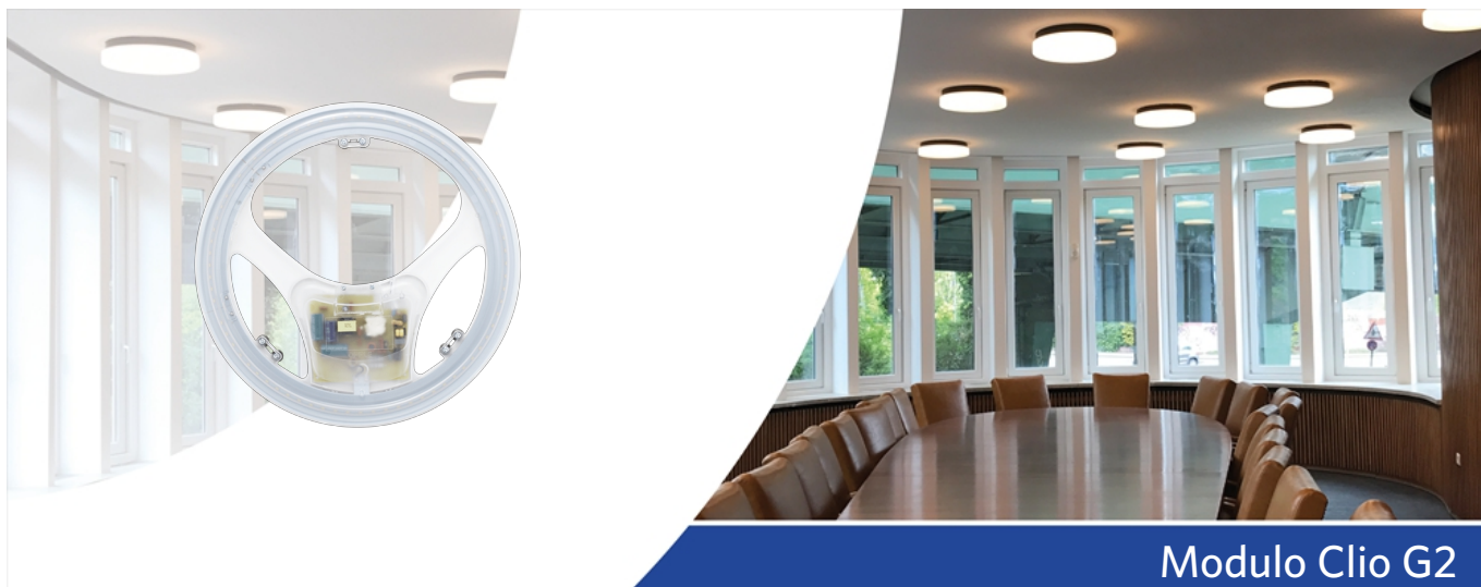
Modulo Clio G2