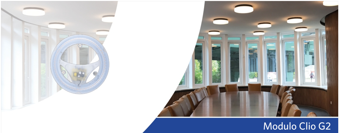
Modulo Clio G2