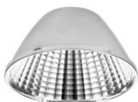
550098000500 LEDSpot3C-C-P R100- Reflector-24D