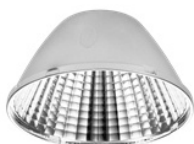
550098000300 LEDSpot3C-C-P R85-Reflector-24D