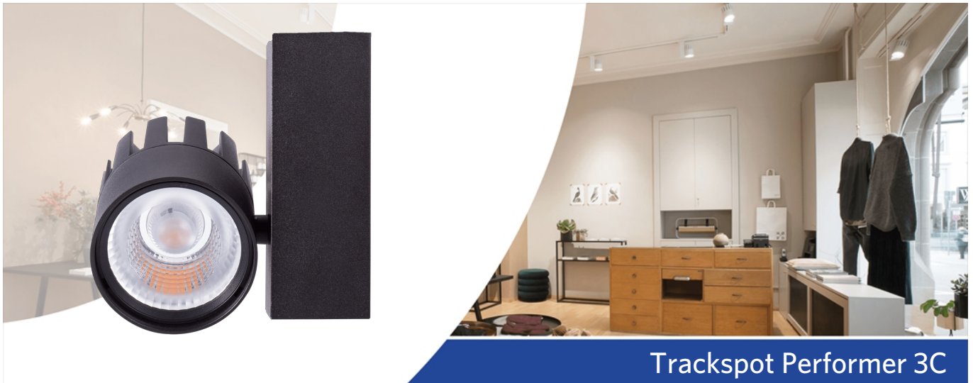
Trackspot Performer 3C