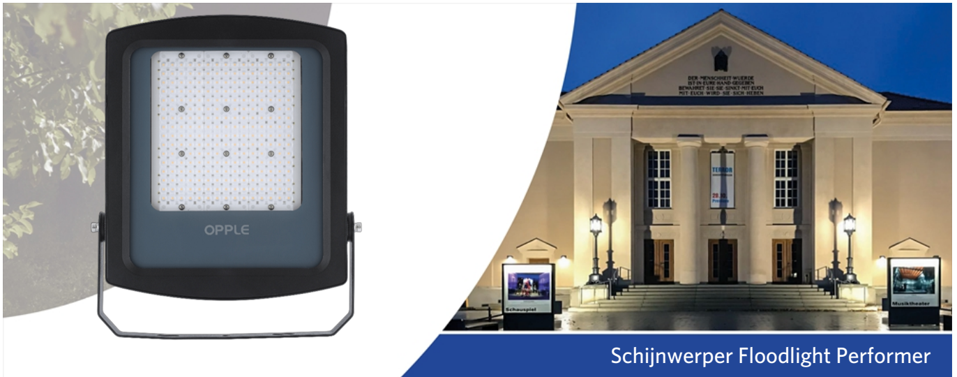
Schijnwerper Floodlight Performer