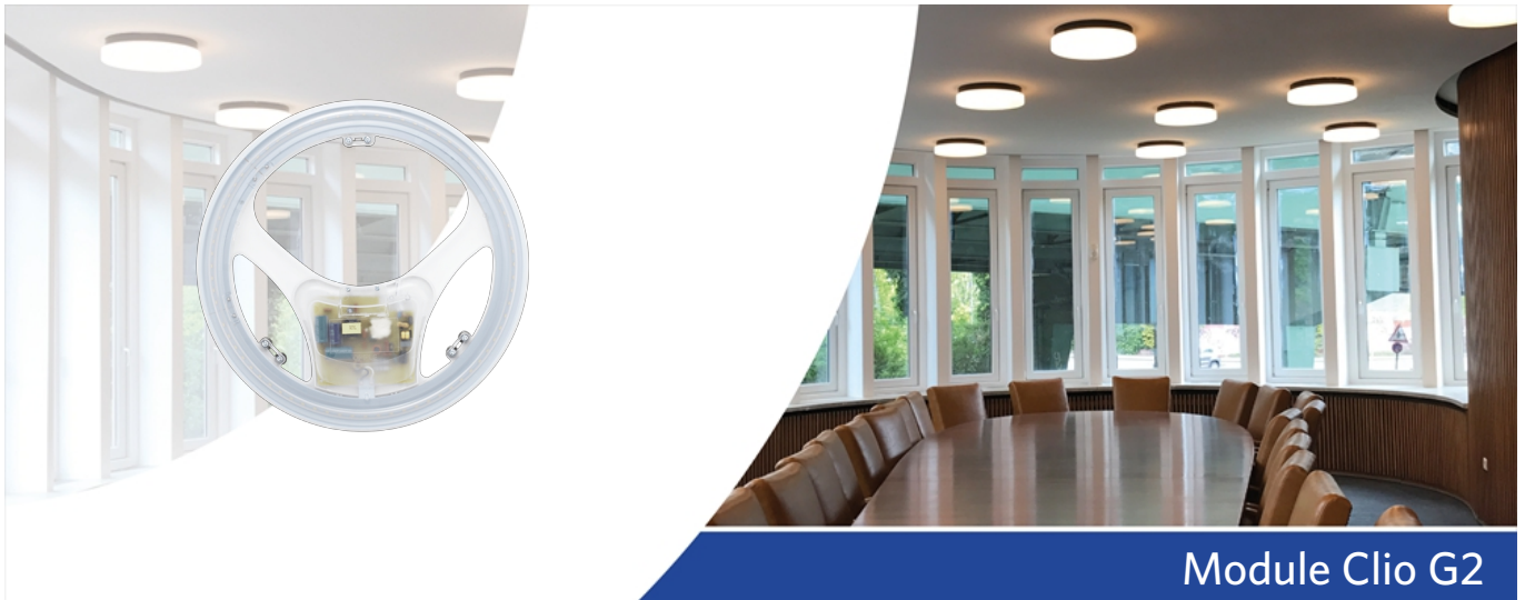
Module Clio G2