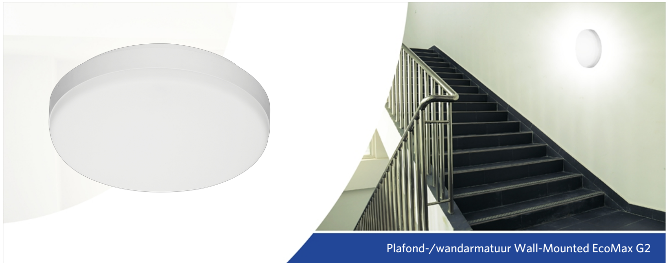
Plafond-/wandarmatuur Wall-Mounted EcoMax G2