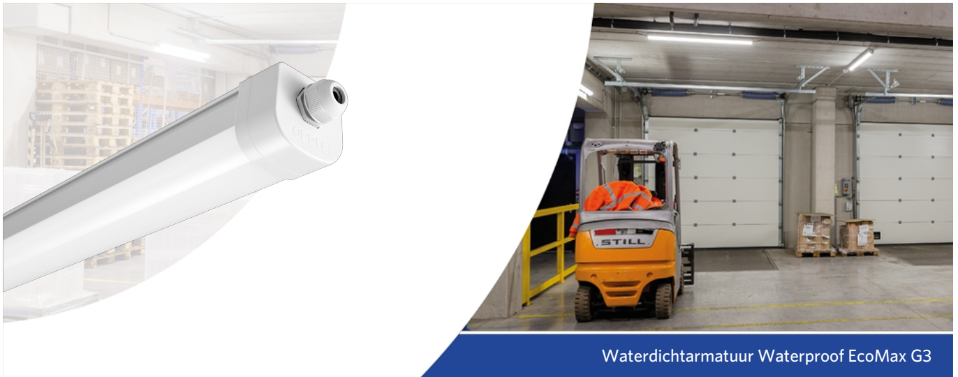
Waterdichtarmatuur Waterproof EcoMax G3