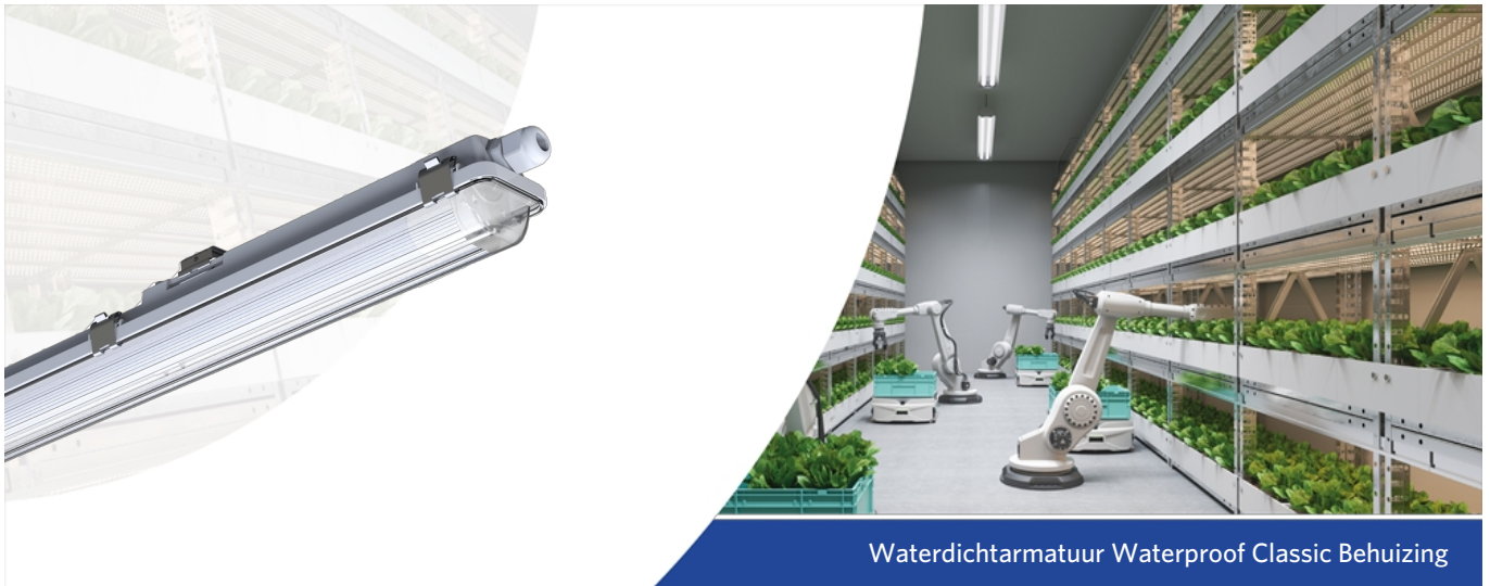
Waterdichtarmatuur Waterproof Classic Behuizing