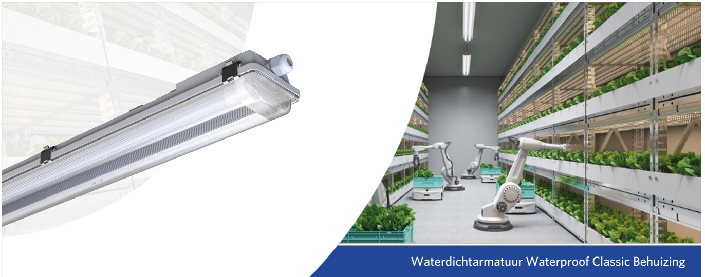
Waterdichtarmatuur Waterproof Classic Behuizing