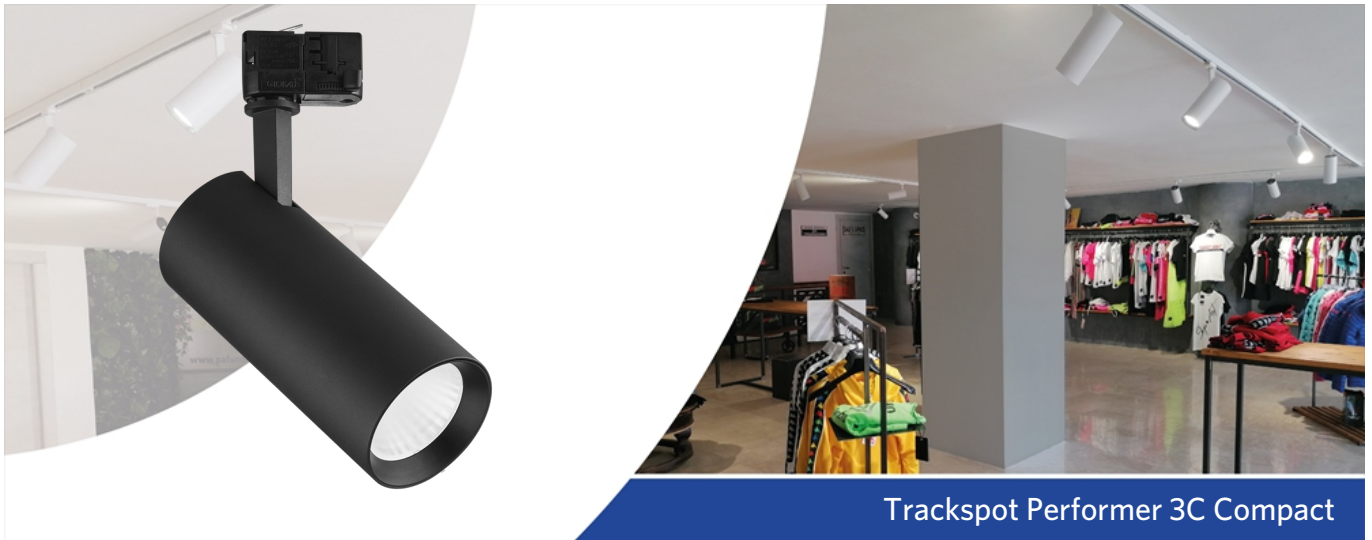
Trackspot Performer 3C Compact