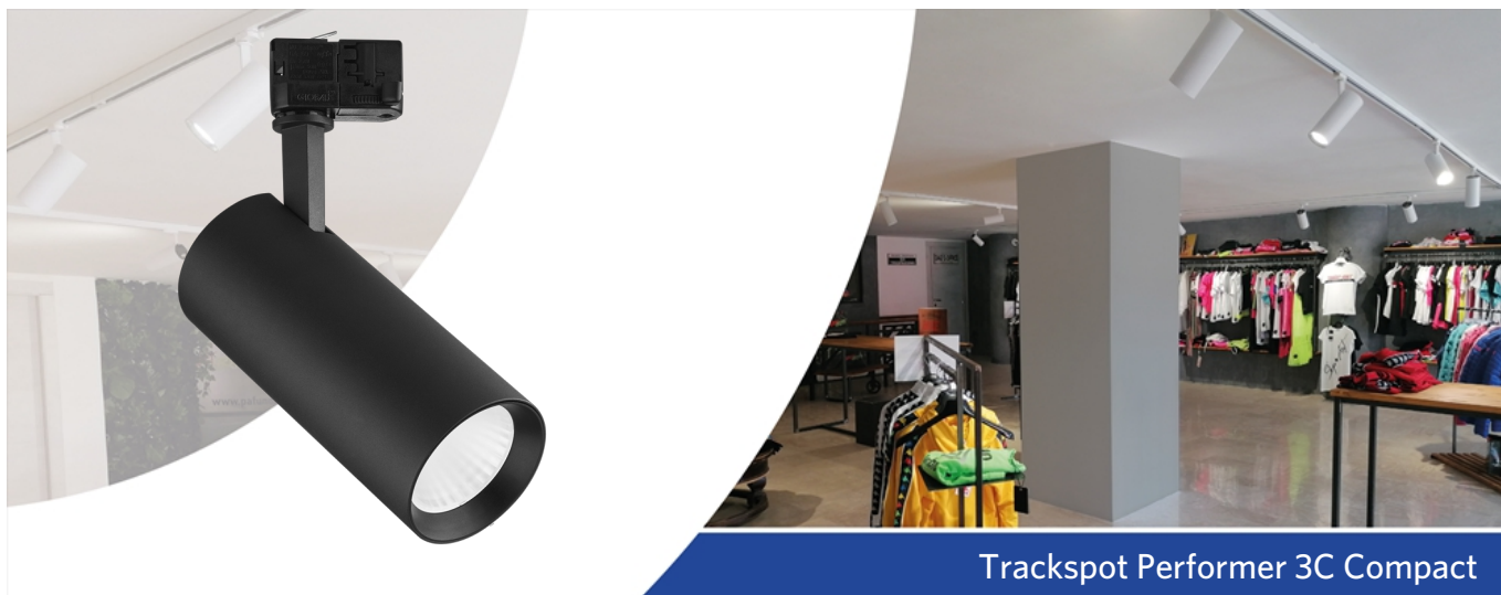
Trackspot Performer 3C Compact