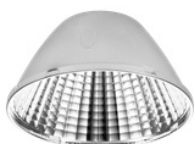
550098000300 LEDSpot3C-C-P R85-Reflector-24D