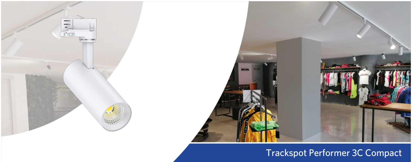
Trackspot Performer 3C Compact