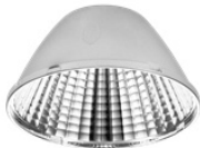
541001187900 LEDSpot3C-C-CS R68-Reflector-24D