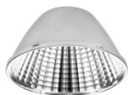
541001188000 LEDSpot3C-C-CS R75-Reflector-24D