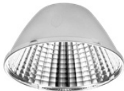
541001187800 LEDSpot3C-C-CS R47-Reflector-24D