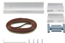
599006008900 LEDLima Connection-Kit