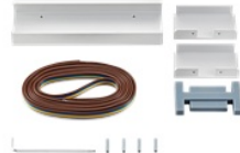
599006008900 LEDLima Connection-Kit