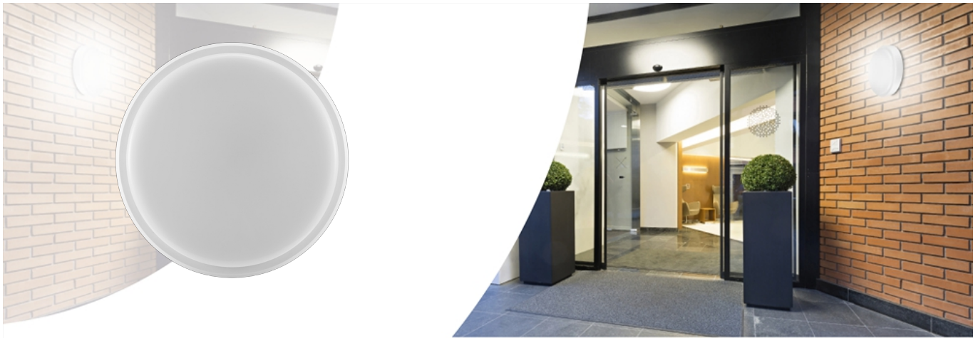
Plafond-/wandarmatuur Wall-Mounted Performer