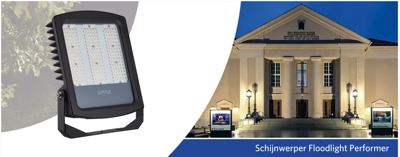
Schijnwerper Floodlight Performer