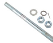
545098003200 LEDHighbay-Pole and Adapter