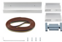
599006008900 LEDLima Connection-Kit