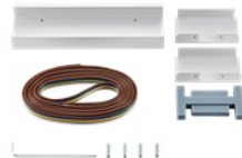
599006008900 LEDLima Connection-Kit