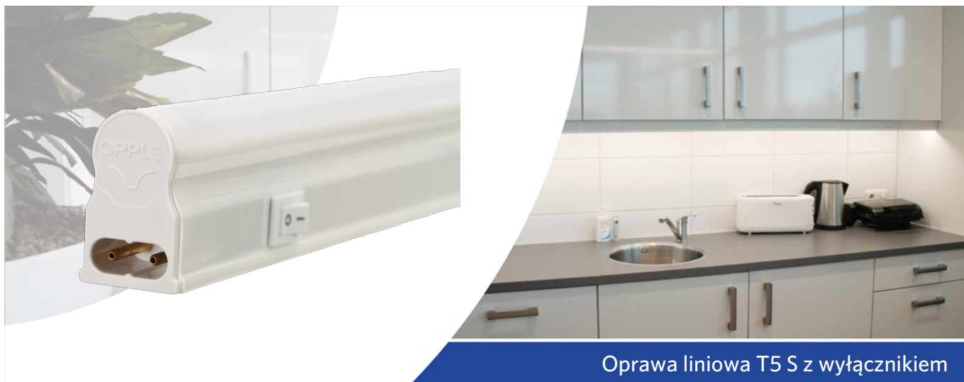
Oprawa liniowa T5 S z wyłącznikiem