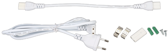
Aksesoria w zestawie