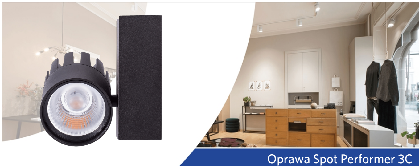
Oprawa Spot Performer 3C