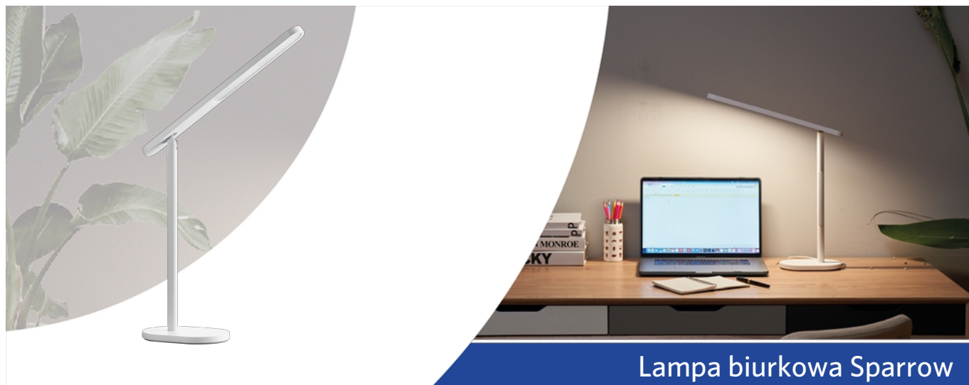
Lampa biurkowa Sparrow