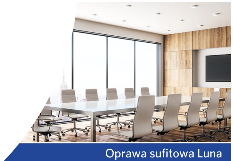
Oprawa sufitowa Luna