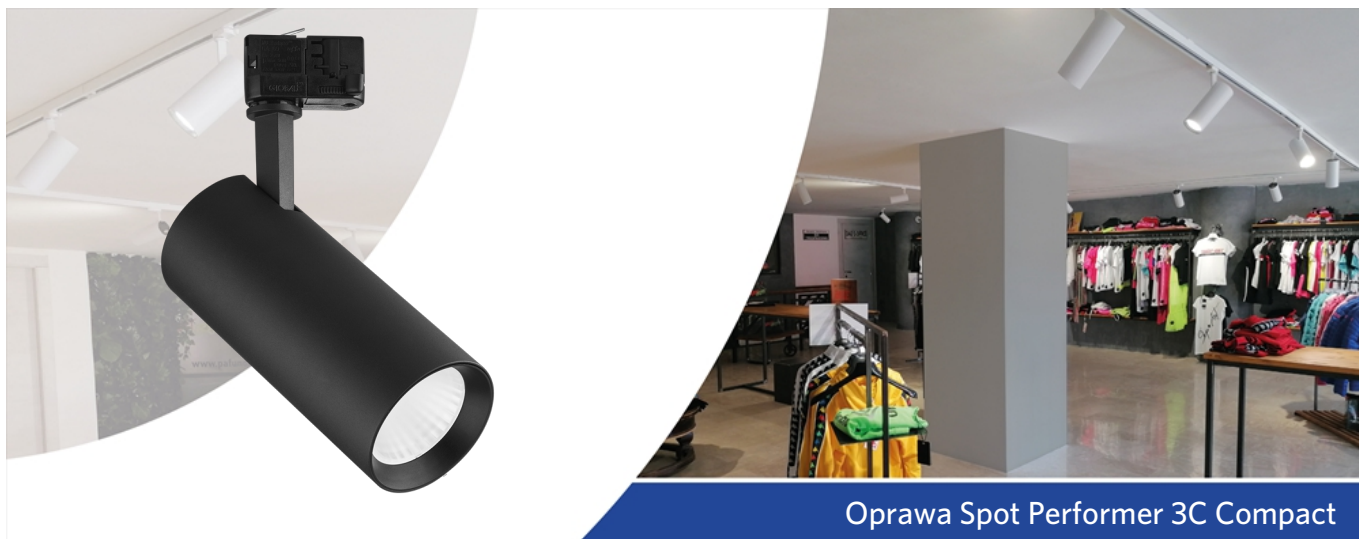
Oprawa Spot Performer 3C Compact