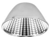
550098000500 LEDSpot3C-C-P R100- Reflector-24D