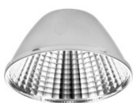
550098000300 LEDSpot3C-C-P R85-Reflector-24D