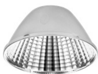
550098000300 LEDspot3C-C-P R85-Reflector-24D