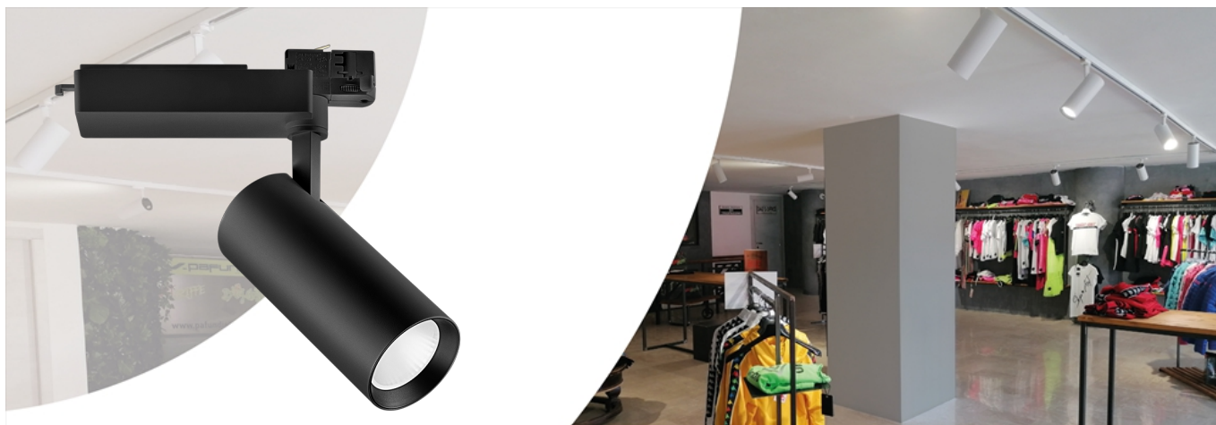
Oprawa Spot Performer 3C Compact