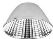
541001187900 LEDSpot3C-C-CS R68-Reflector-24D