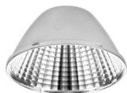
541001188000 LEDSpot3C-C-CS R75-Reflector-24D