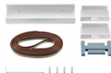
599006008900 LEDLima Connection-Kit