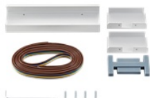
599006008900 LEDLima Connection-Kit