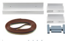
599006008900 LEDLima Connection-Kit