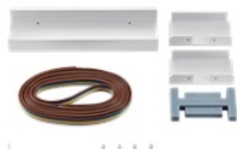
599006008900 LEDLima Connection-Kit