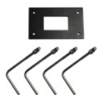
703098000300 LEDBollard-Luke-E Concrete-Mounting-Kit